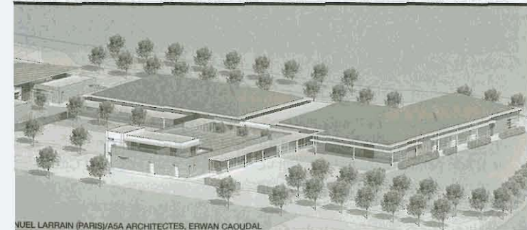
YVES LARRAIN (PARIS)/ASA ARCHITECTES, ERWAN CAOUJAL